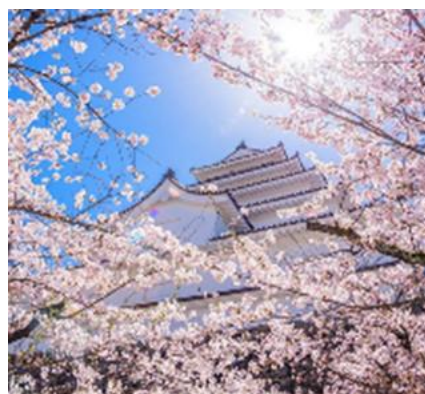
kengo_photography さま 福島県 会津若松城