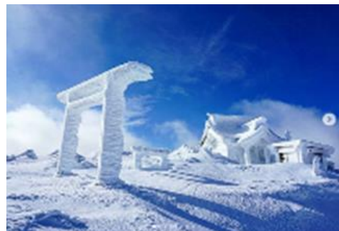
miipekoo さま 宮城県 刈田岳山頂