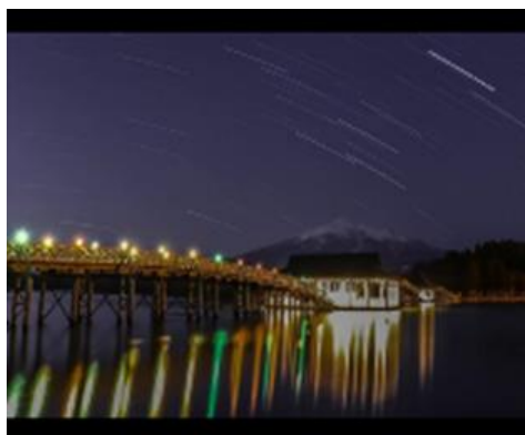
toru_luoto さま 青森県 鶴の舞橋