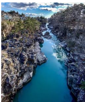
tetsuwest さま 岩手県 巖美溪