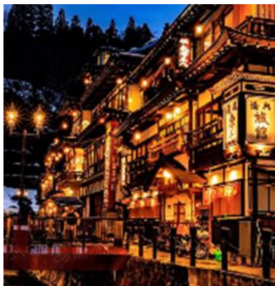
masaki__75 さま 山形県 銀山温泉